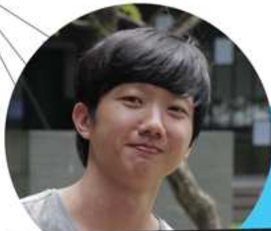
Aw See Wee