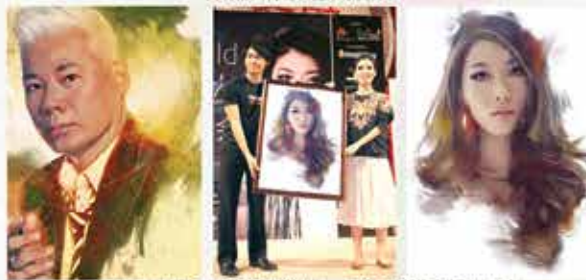
林承辉画一幅肖像画最快约需5个小时，最长时间的画作则花了3天。看为中国歌手曲婉婷的肖像画完全能感觉他的用心。