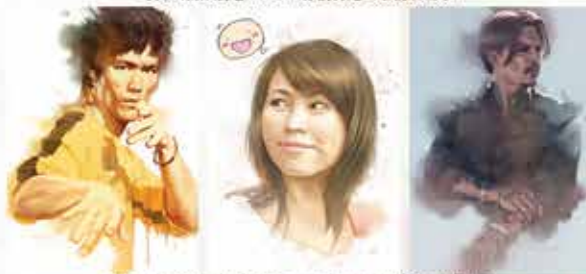
肖像画的关键是相似度要高，再来就是色彩和色调的协调。好的肖像画必须画得比照片更传神，所以作画时必须考虑到人物的角色和造型，两者搭配得当视觉效果更好。