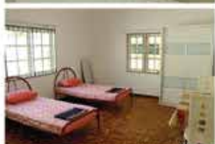
Rejoice Home欢乐之家的部分设施