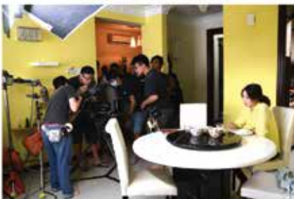
▲《记忆中的菜单》拍摄现场

《记忆中的菜单》新年电视剧 集数：8 播出日期：2016年1月25日至2月4日 播出时间：星期一至星期四，晚上9点半至10点半 《记忆中的菜单》新年电视电影 集数：1 播出日期：2016年2月8日（年初一） 播出时间：晚上8点半至10点半