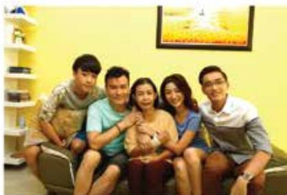
▲《记忆中的菜单》全体演员

欲知更多有关ntv7详情，可浏览ntv7官方网站： www.ntv7.com.my ，关注ntv7面子书： ntv7chinese 及Instagram： ntv7chinese 。如今，您也可浏览 www.tonton.com.my 重温ntv7的节目，同时也可透过付费电视第107频道观看ntv7。