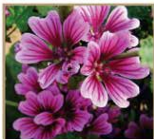
锦葵 // Malva Sinensis