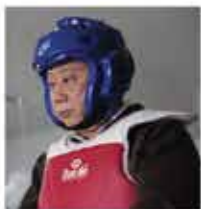
爷爷 (夏雨 饰)

金马伦是个园丁。他每天都花了很多心思在工作上,也会定时送花到平安妈妈的花店里。在他的世界里,爱情永远是最重要的,为了心爱的女人,他甚至把对方的名字“GIGI”刺在手臂。可惜女方嫌弃他的经济状况,并且谎称自己有一个7岁大的孩子,种种巧合造成了他与平安之间的误会,两条平行线开始暧昧横生。