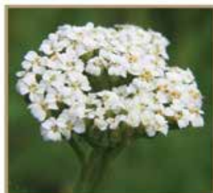
黄花九轮草 // Primula Officinatis