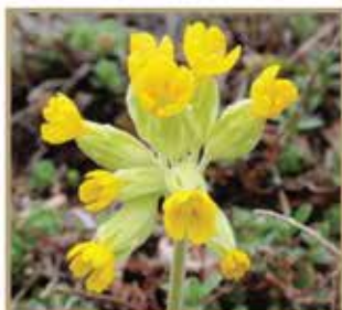
欧耆草 // Achillea Mellefolium