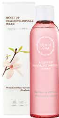
Moist Up Hyalurone Ampoule Toner 200ml