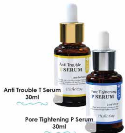
Anti Trouble T Serum 30ml