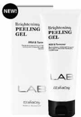
Brightening Peeling Gel 100ml