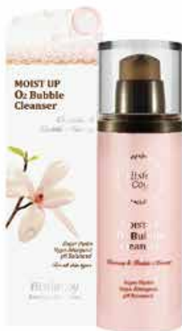
Moist Up O2 Bubble Cleanser 100ml