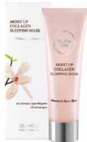
Moist Up Collagen Sleeping Mask 50ml