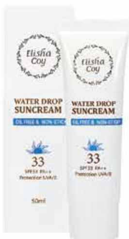
Water Drop Suncream 50ml